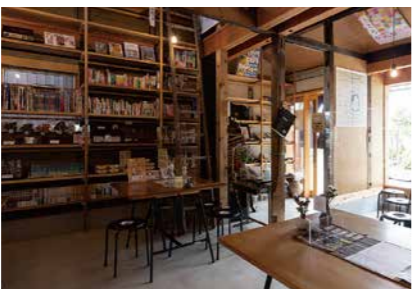
↑城小屋マルコ 福井県坂井市丸岡町霞町1-25 ☎0776-65-9912 ☎8:00～17:30 (休)月曜(祝日の場合は営業、翌日休)

霞ヶ城の別名があり、春の桜満開の中に浮かぶ姿は幻想的です。園内には約400本のソメイヨシノが植えられ、日本のさくら名所100選にも認定されています。