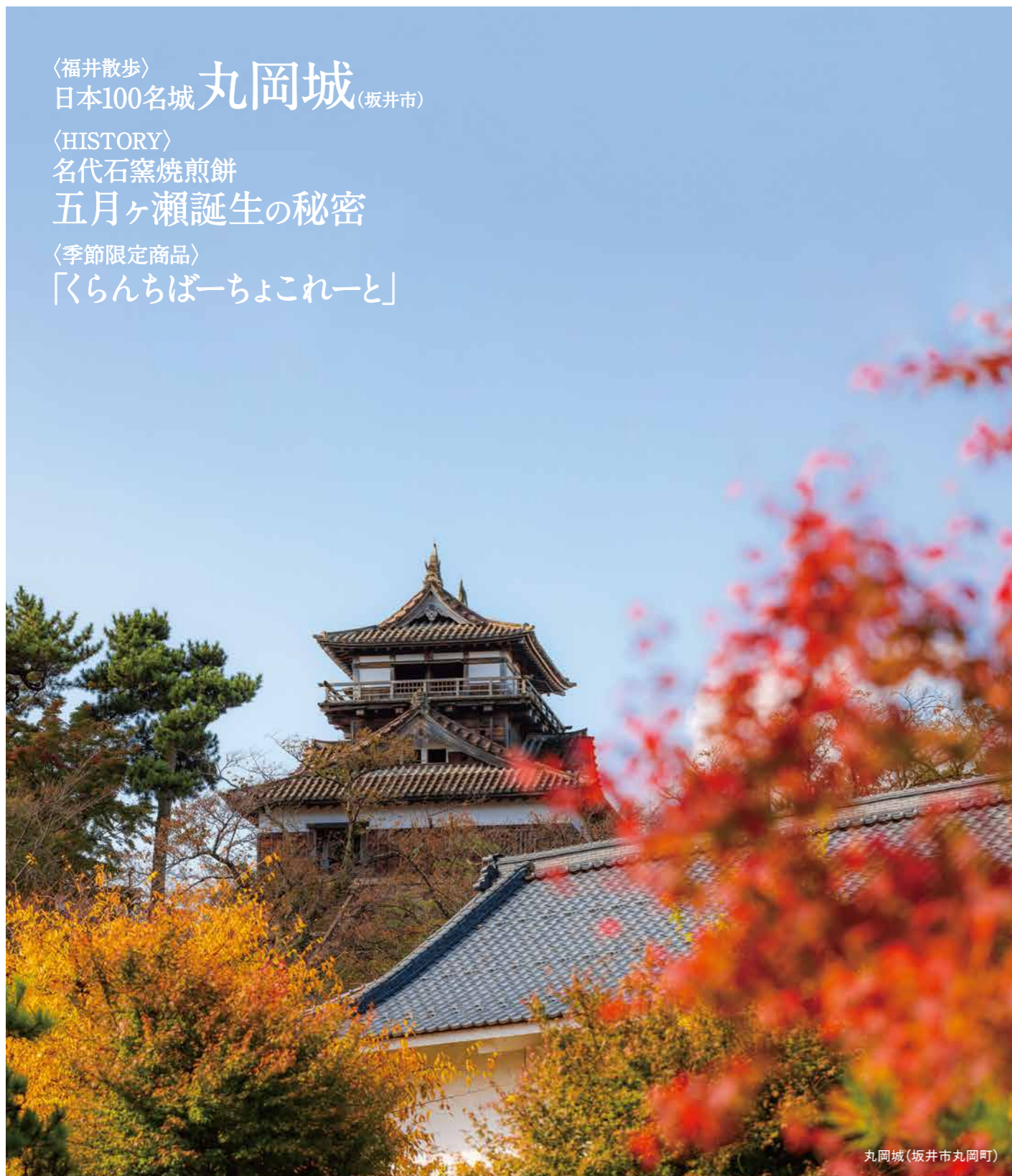
丸岡城(坂井市丸岡町)